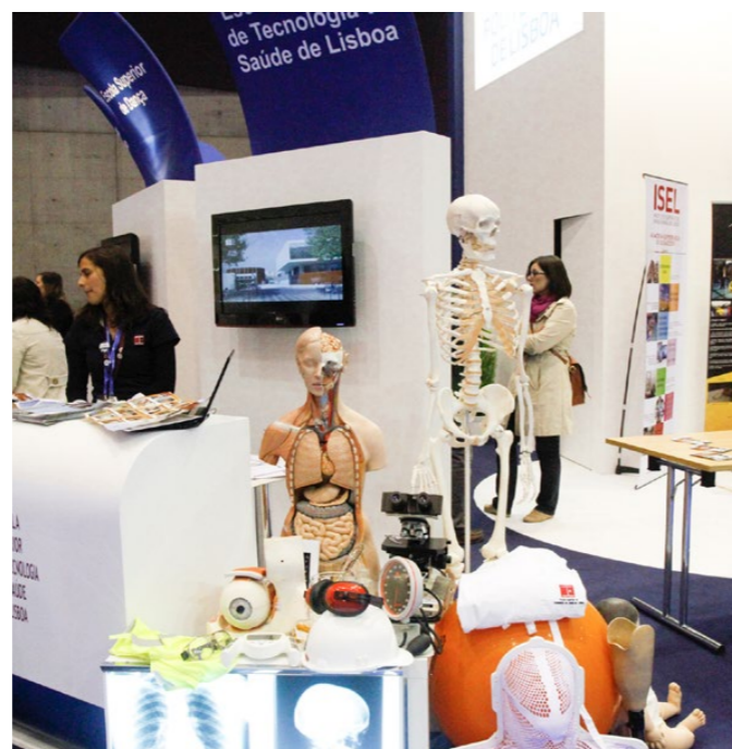
A ESTeSL promoveu várias atividades ao longo do certame