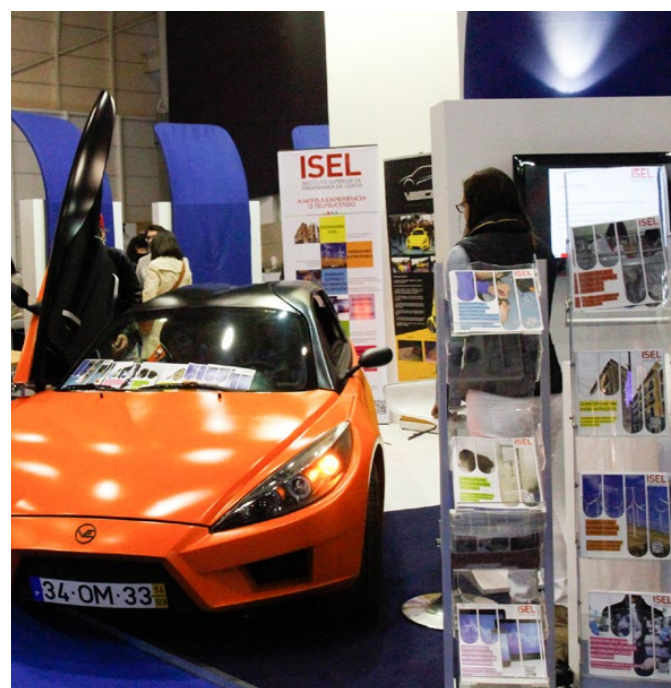
O Veeco esteve em exposição durante os 4 dias da Futurália