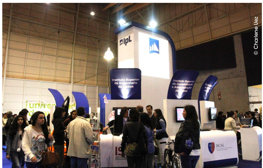
Stand do Instituto Politécnico de Lisboa na Futurália 2014

MAIS DE 64 mil jovens estiveram maior salão de oferta educativa realizado em Portugal, de 26 e 29 de março, no Parque das Nações, onde mais uma vez o Instituto Politécnico de Lisboa marcou presença.