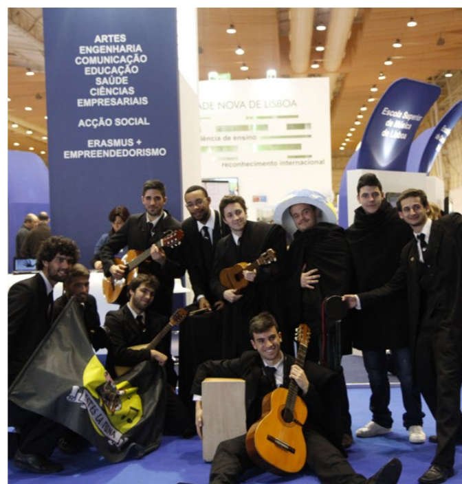
A ESTeS La Tuna Masculina atuou junto ao stand do IPL