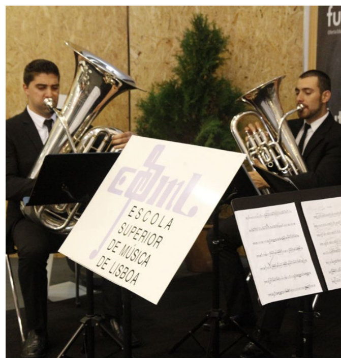
Os estudantes da ESML atuaram no Café Lounge da Futurália