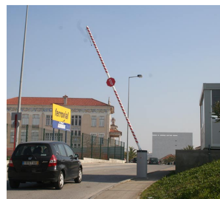
Entrada do lado sul aberta 24 horas

O ACESSO ao Campus de Benfica do Instituto Politécnico de Lisboa está a ser controlado, desde o dia 1 de Janeiro, para garantir maior segurança aos alunos professores e funcionários da Escola Superior de Educação e da Escola Superior de Comunicação Social e Serviços de Acção Social.