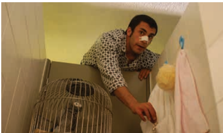
A Tigela conquistou o Prémio do Público

O FILME “A Tigela”, imaginado, produzido e realizado por um grupo de alunos da Escola Superior de Teatro e Cinema, foi distinguido no Estoril Film Festival com o Prémio do Público. Atribuído pelo Instituto da Juventude, o galardão resulta da votação do público