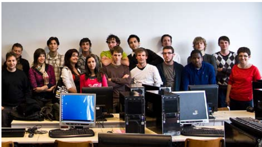
Grupo de Estudantes dos países participantes no Intensive Program, ISTAR - dot

A participação portuguesa mistura duas áreas: uma ligada à gestão ou business e outra à multimédia. Os participantes deste ano estão a desenvolver modelos de negócio possíveis, de modo a dar continuidade ao desenvolvido pelos participantes do ano anterior.