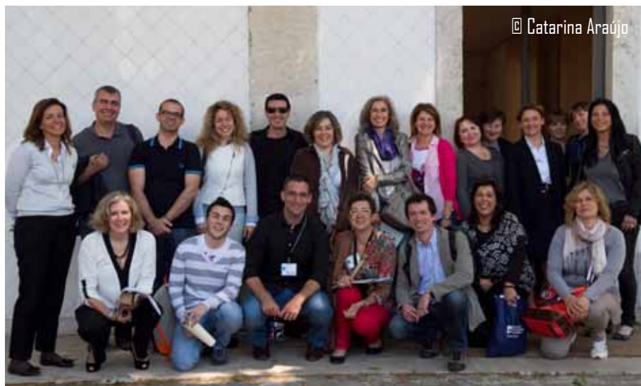
O grupo de participantes estrangeiros e a equipa organizadora da Semana Internacional no IPL

À tarde, com o apoio da Câmara Municipal de Lisboa, os funcionários estrangeiros conheceram os principais pontos da capital portuguesa com a Lisbon SightseeingTour by bus.