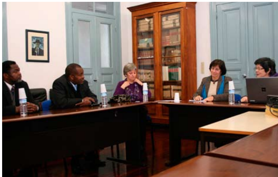
A comitiva moçambicana na visita à Escola Superior de Educação

licenciatura, mestrado e doutoramento. A reforma em curso vai permitir aos estudantes moçambicanos que queiram frequentar cursos em universidades de noutros países, maior facilidade nas equivalências.