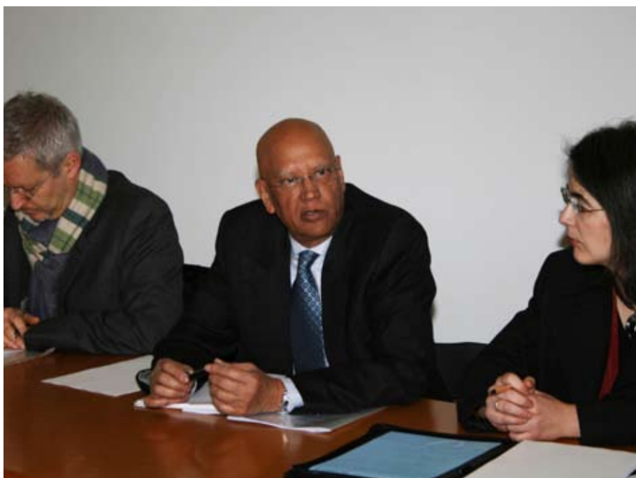
O presidente do painel da OCDE, Abrar Hasan, ladeado pelos colegas da Itália e da Alemanha

O número de alunos no ensino artístico tem vindo a aumentar, mas não em quantidade suficiente para que os profissionais da arte se possam tornar eles próprios consumidores de arte, gerando um mercado cultural de maiores dimensões. Foi solicitado aos presentes a elaboração de um documento institucional que reúna um consenso por parte das escolas artísticas do IPL, quanto às mudanças que consideram fundamentais para a melhoria do ensino artístico, nomeadamente ao nível da legislação aplicada.