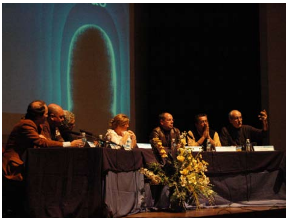
Being Digital levou ao auditório da ESCS profissionais do cinema e da televisão

Uma exposição no átrio do peso -1 deu a conhecer aos alunos vários equipamentos das marcas mais representativas do mercado, na área do cinema e da televisão.